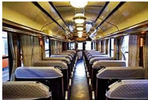
列車内のイメージ